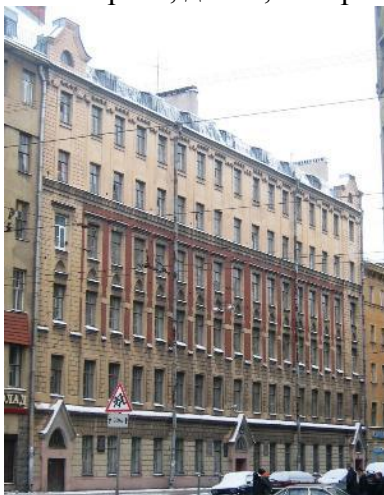
Загородный пр., д. 64, литера А