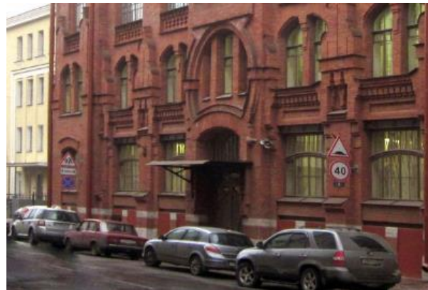
Ул. Егорова, д. 26а, литера А