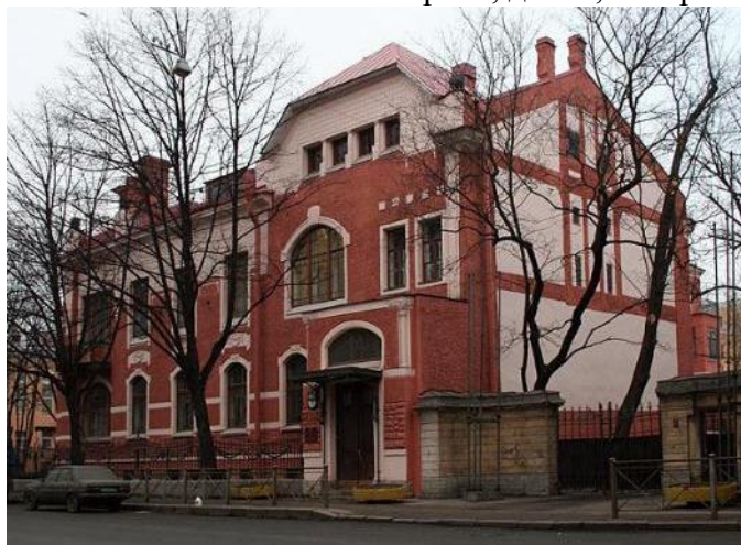
Рижский пр., д. 29, литера А