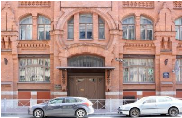
Ул. Егорова, д. 26а, литера А