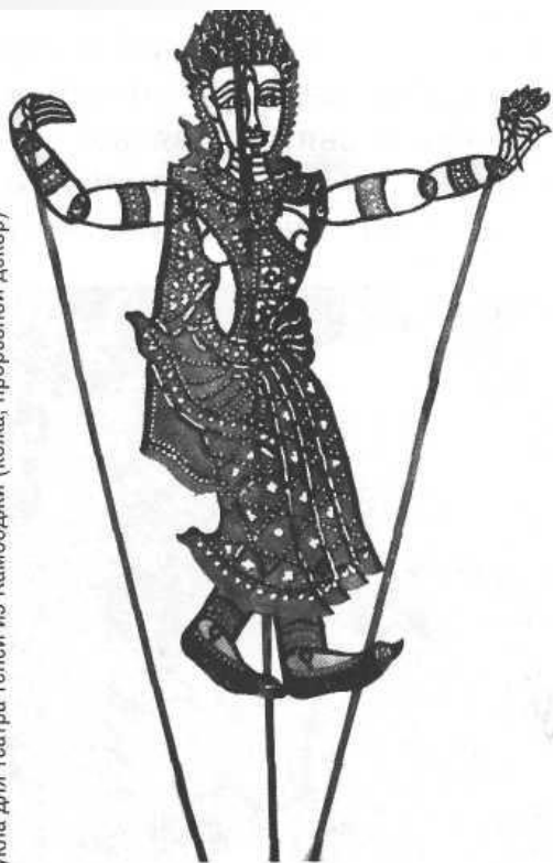
Кукла для театра теней из Камбоджи (кожа, прорезной декор)