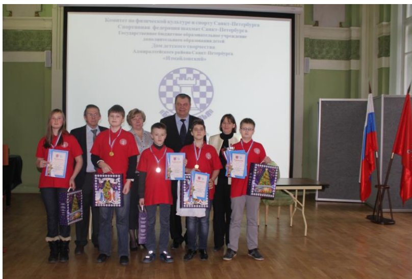
Команда Второй Санкт-Петербургской Гимназии Адмиралтейского района - победитель «Белой ладьи – 2015»