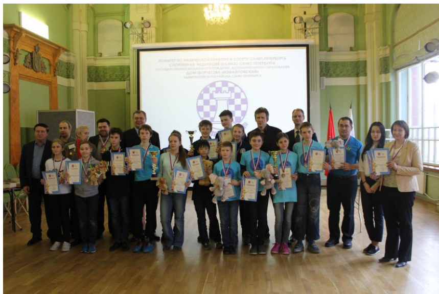
Победители и призеры «Белой ладьи» - 2017