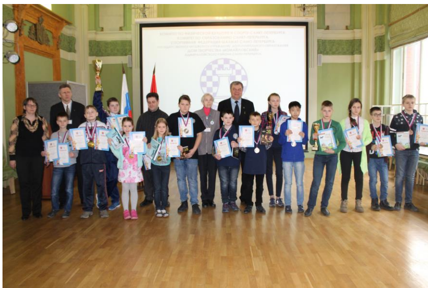
Победители и призеры «Белой ладьи» - 2018