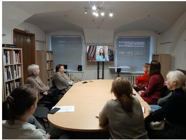
Практический семинар «Символ года», 17.02.2026